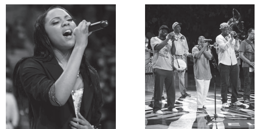
■ハーフタイムショーの様子

具体的実践している施策として、「地域のパフォーマーの公募」がある。公募は常に行われており、応募したい人はいつでも公式HPから応募することができる。公募しているパフォーマンスには、「試合のハーフタイムに行われるショー（5～6分）」「試合開始前の国家斉唱」といったものがある。